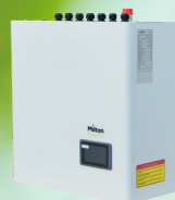
Indedel uden VVB