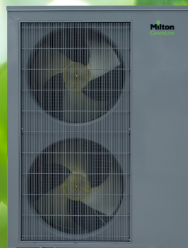
Udedel 15 og 19 kW

Konstruktionen betyder også et yderst lavt lydniveau ned til 52 dB(A) målt efter ErP standarden.